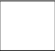
圖 1. 圖標題