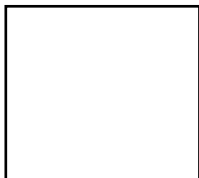
圖 1. 圖標題